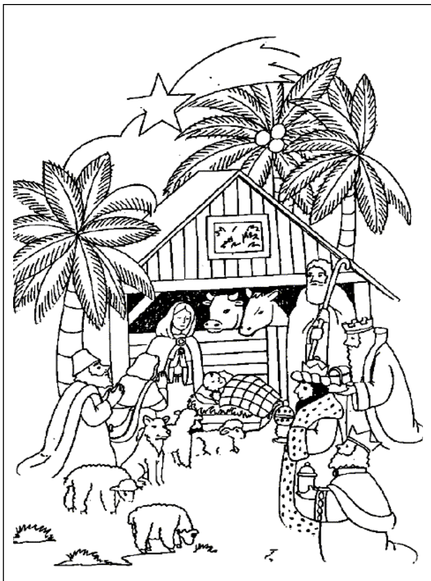
De geboorte van Jezus