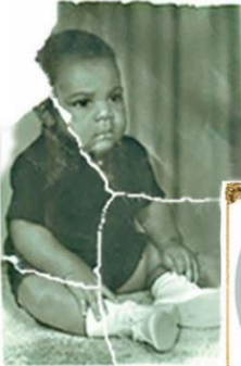
FOTO & VIDEO-REPORTAGE - HUWELIJK & FEEST